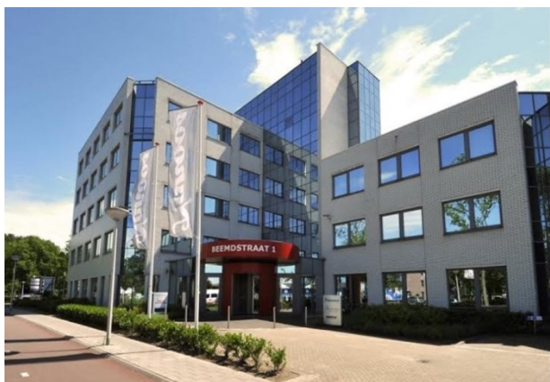
Kantoorgebouw te Eindhoven