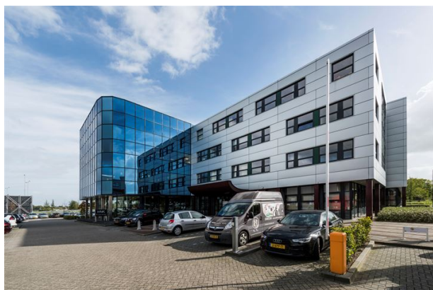
Kantoorgebouw te 's-Hertogenbosch