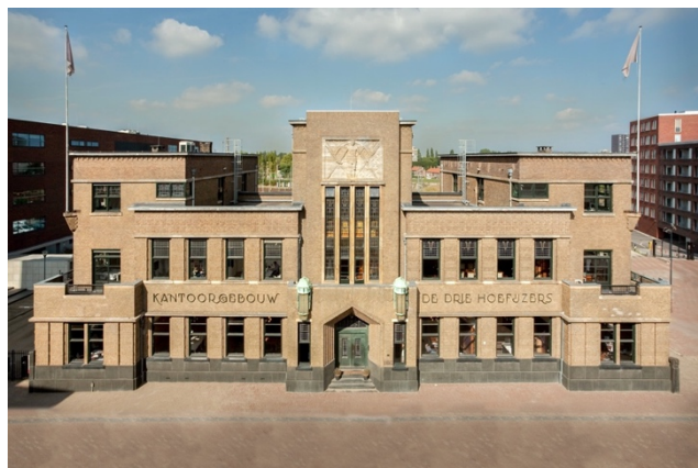
Kantoorgebouw 'De Drie Hoefijzers' te Breda